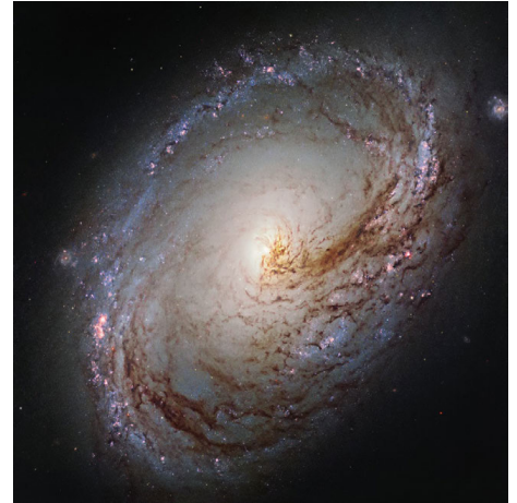
Galaxias como la M96 están alejándose las unas de las otras.

La mayoría de las galaxias que podemos observar se están alejando las unas de las otras a medida que el universo se expande. Como pasa con las bandas elásticas de esta actividad, el espacio se está expandiendo y estirando. Pero no todo se expande. Algunos objetos se mantienen firmemente unidos por la gravedad, tal y como nuestros cuerpos, la Tierra, nuestro sistema solar, e incluso las galaxias como la Vía Láctea. Al igual que los botones de nuestro modelo, estos conservan su tamaño, incluso cuando la distancia entre ellos aumenta. A medida que el elástico de nuestro modelo se estira, los botones exteriores se alejan del centro más rápidamente que los botones internos. Los astrónomos han observado y calculado que las galaxias distantes también parecen estar alejándose de nuestra perspectiva más rápidamente. Esto se debe a que la velocidad a la que una galaxia se aleja de nosotros es directamente proporcional a la distancia a la que está de nosotros, una relación que ahora conocemos como la Ley de Hubble .