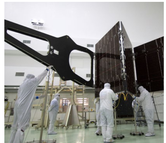
Tripletación de la NASA construyendo la nave espacial Juno.

La misión Juno de la NASA está estudiando el planeta de gas Júpiter y sus lunas. Juno está haciendo sondeos bajo la cubierta de nubes para averiguar más sobre el origen del planeta, su estructura, atmósfera y campo magnético. Al final de la misión, Juno saldrá de su órbita intencionalmente (se estrellará) contra Júpiter para evitar contaminar sus lunas con microbios de la Tierra. Los científicos no quieren que Juno impacte cualquier posible forma de vida foránea, y ¡no quieren que en un futuro los investigadores “descubran” accidentalmente algo que en realidad llegó allí desde la Tierra durante una expedición anterior!