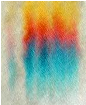
El color moviéndose a través del papel

El pigmento en la tinta se disuelve en el agua porque es soluble. La acción capilar permite que el agua se desplace a través del papel, arrastrando también el pigmento. La velocidad con la que viaja el pigmento depende del tamaño de sus moléculas y qué tan fuerte es la atracción del pigmento hacia el papel. Los espacios entre las fibras del papel actúan como tubos capilares.