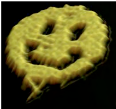
Carita feliz hecha de ADN

El autoensamble es un proceso a través del cual las moléculas y las células se organizan a sí mismas en estructuras funcionales. El autoensamble ocurre en la naturaleza: los copos de nieve, las burbujas de jabón y el ADN son sólo tres ejemplos de cosas que se construyen a sí mismas.