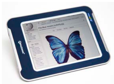
Pantalla electrónica de bajo consumo energético

Algunas nanotecnologías y materiales están inspirados en la naturaleza. Los científicos están trabajando en nuevas tecnologías que imitan las alas de la mariposa morfo azul. Ya han inventado pantallas de teléfonos inteligentes de bajo consumo energético, pinturas y telas que cambian de color cuando se cambia el espacio entre los materiales.